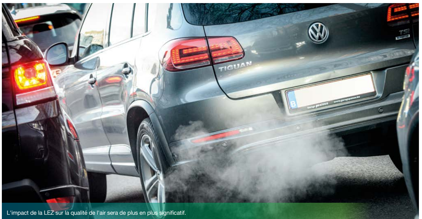
L'impact de la LEZ sur la qualité de l'air sera de plus en plus significatif.