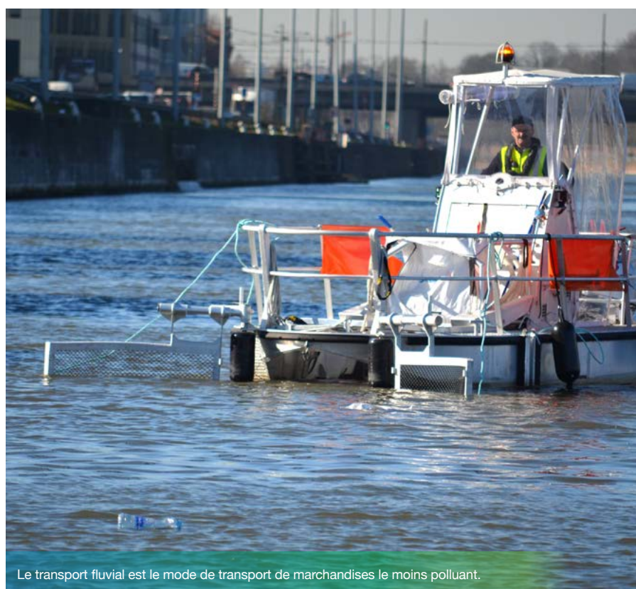
Le transport fluvial est le mode de transport de marchandises le moins polluant.

Vous souhaitez avoir plus de renseignements sur le Label Entreprise Ecodynamique ? Contactez le helpdesk du Label sur info@ecodyn.brussels